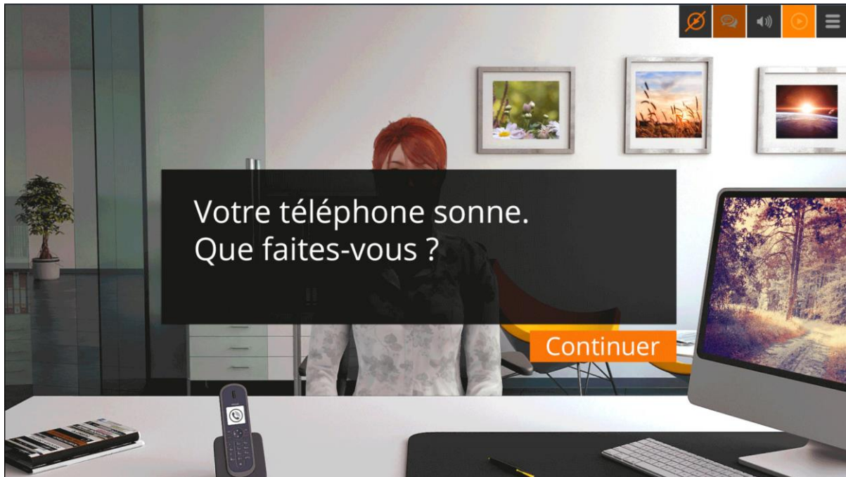
Exemple de zone cliquable avec un téléphone qui interromp un entretien

Il en résulte une véritable interaction avec l'apprenant, ce qui permet non seulement de vérifier l'acquisition des compétences mais également de favoriser son implication. Plus motivé, l'apprenant a une meilleure rétention du contenu pédagogique. Dans le cadre des simulations immersives, associer interactivité et implication multiplie l'efficacité des dispositifs produits avec VTS Editor.